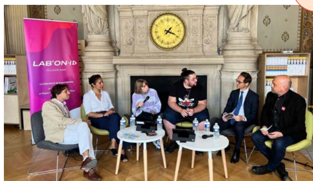
Interview en direct sur Twitch sur l'émission Lab'On, Île-de-France